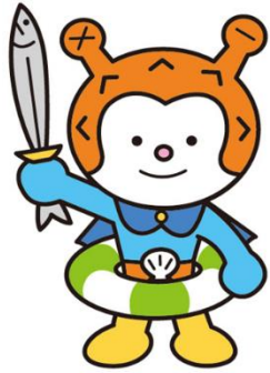
気仙沼市観光キャラクター「海の子 ホヤほーや」